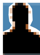
Cyril Demortier magasinier